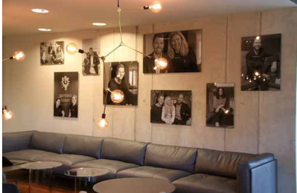
Porträts von der Familie und dem Hotelteam zeigen den persönlichen Bezug der Gambinos zu ihrer eigenen Marke.